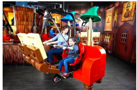
マーリンアプレントイス