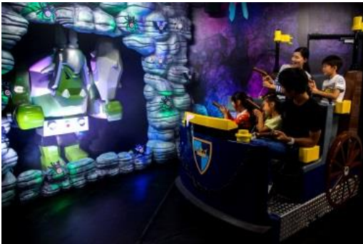
キングダムクエスト