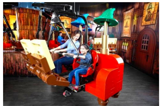
マーリンアプレンティス